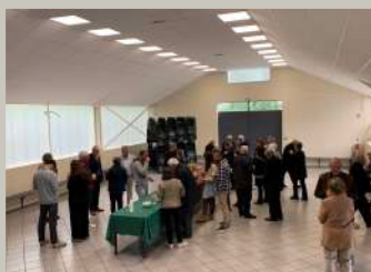
Un moment convivial à la salle des fêtes