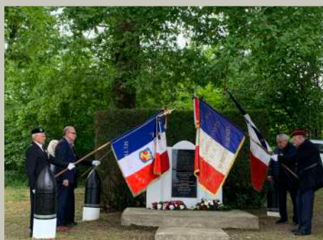
Le temps du recueillement