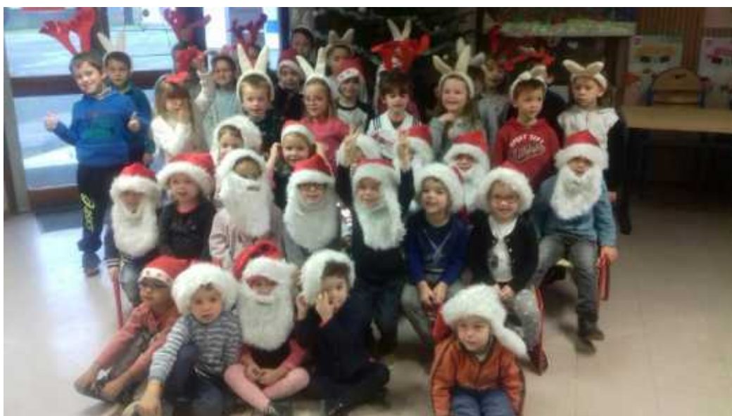
Mais qui sont donc tous ces petits rennes et ces Pères Noël ? Les enfants de la maternelle et du CP réunis à l'école de Momères, bien sûr !