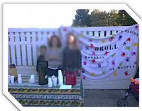
Café d'accueil de la rentrée scolaire 2014