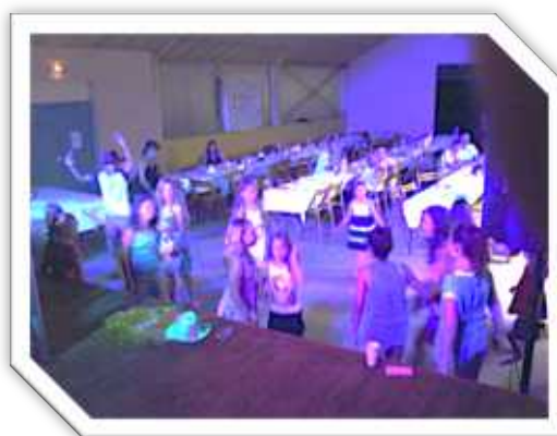
Fête de fin d'année juin 2013 et 2014